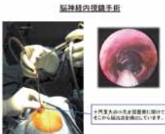
脳神経内視鏡手術

また当科では、昨今急増する認知症の外科治療にも取り組んでいます。頭部外傷を契機に発症する「慢性硬膜下血腫」や「脳腫瘍」、これらに加えて「正常圧水頭症」が手術で治せる認知症です。脳神経センターが発足し、認知症のより正確な診断と、手術適応の判断が可能になりました。認知症は治らないとあきらめないで、是非一度ご相談においで下さい。